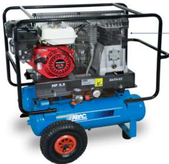
B3800BF/2 x 11 C5