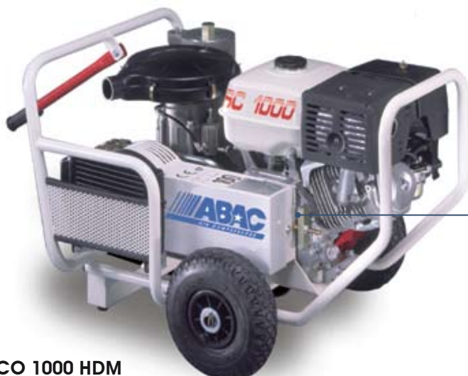
ECO 1000 HDM