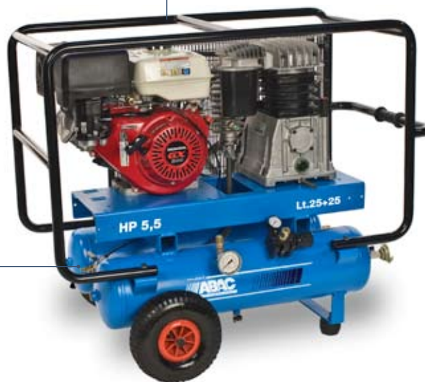
B5900BF/2 x 25 C8