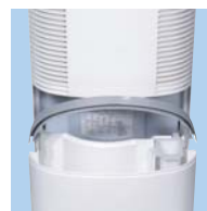
Réservoir amovible de 4 litres