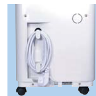
Enrouleur pour câble d'alimentation