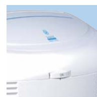
Hygromètre gradué de 40 à 90%