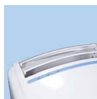
Défecteur + voyant de fonctionnement en façade