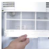
Filtre à air accessible facilement pour nettoyage