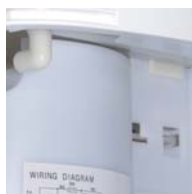
Evacuation permanente des condensats