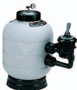
Filtre lateral Side-mount filter