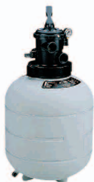
Filtre Top Top-mount filter