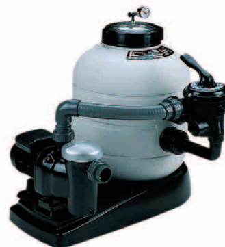
Monobloc lateral Side-mount monobloc