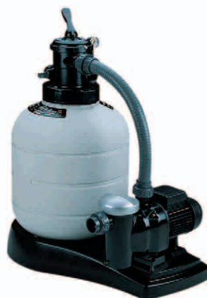
Monobloc Top Top-mount monobloc