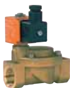
Electrovanne ESM 86 24 V ou 230 V