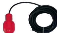
MICROSTART Interrupteur de niveau