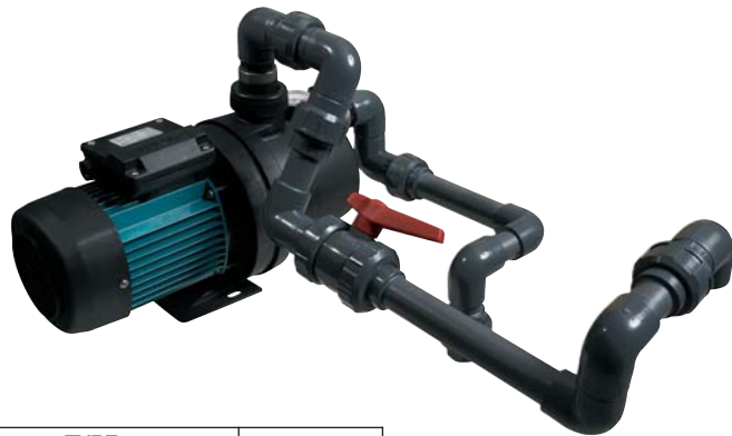
● ● ● Kit surpresseur pour balais automatiques