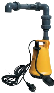
● ● ● Kit Vide cave