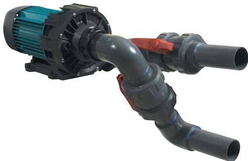
● ● ● Kit nage à contre-courant