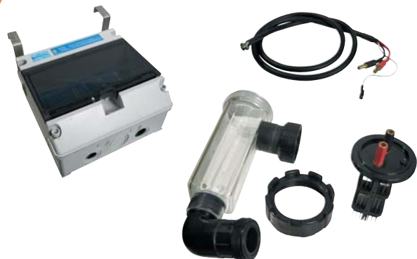
● ● ● Kit électrolyseur