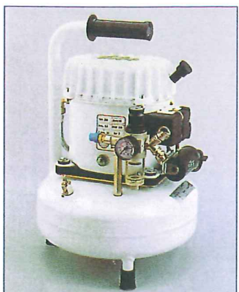
SIL AIR 09 - SIL AIR 15