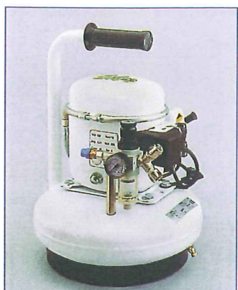
SIL AIR 06