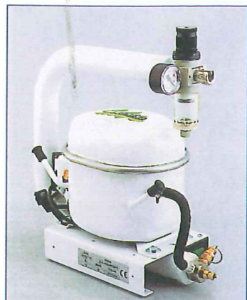
SIL AIR 01